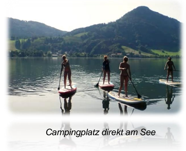
Campingplatz direkt am See